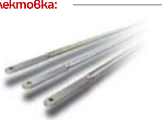
Комплект лостове Покритие: Z - Цинк