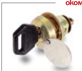
Ключалка едностранна със секрет 1102.102 или 1102.201